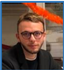
マルワン (フランス)