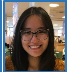
ステファネ (ブラジル)