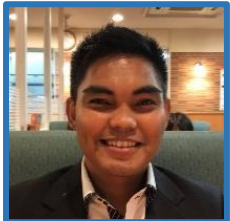
ジェリー (フィリピン)